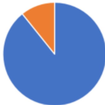
Valoare proiect cu ajutor de stat